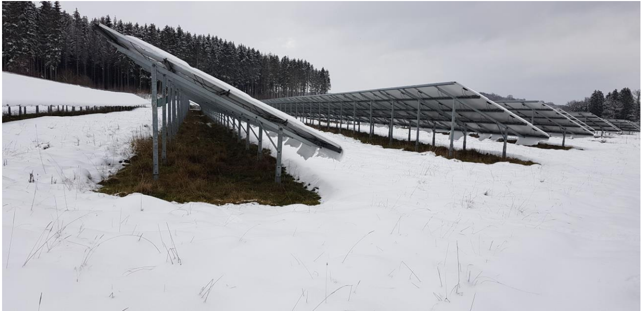
Foto 1. Schneefreie Zonen unter den Modulflächen werden häufig von Greifvögeln wie z. B. dem Turmfalke zur Nahrungssuche im Winter genutzt.